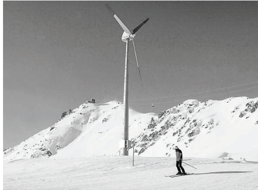
Überall Energie: Eine neue Gesetzesvorlage soll noch mehr staatliche Förderung für erneuerbare Energien aktivieren.

Sofern das Parlament den Vorschlägen der Kommission zustimmt, werden ab nächstem Jahr genügend zusätzliche KEV-Mittel für Windräder,